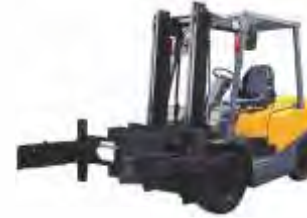
Захваты для бочек

С другим навесным оборудованием, вы можете, ознакомиться на нашем сайте liugongactio.ru