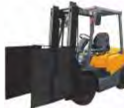
Захваты для КИП