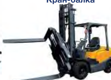
Ротатор с позиционером