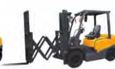
Вилы с пантографом