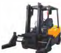
Захват для блоков