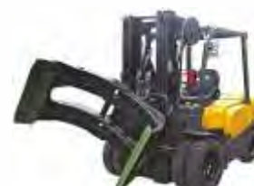
Захват для рулонов