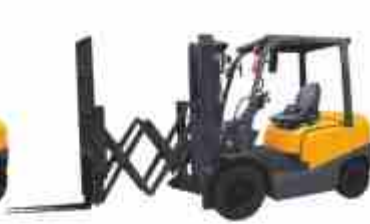
Вилы с пантографом