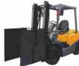
Захваты для КИП