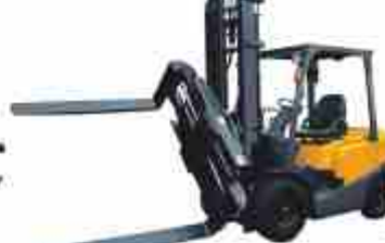
Ротатор с позиционером