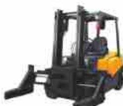
Захват для блоков