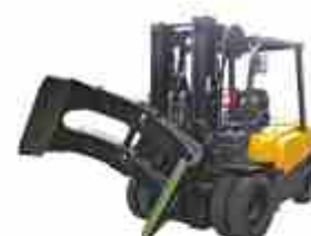
Захват для рулонов