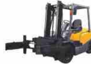
Захваты для бочек

С другим навесным оборудованием, вы можете, ознакомиться на нашем сайте liugongactio.ru